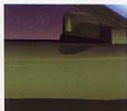
421 ダークオリーブパール