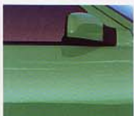
422 ターコイズブルーパール