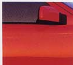
609 スペシャルレッド(850R専用色)