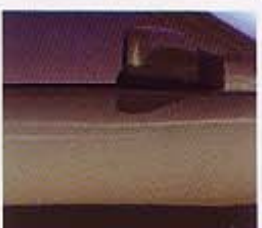
427 ダークグリーンパール

●写真の仕様は、日本仕様とは異なる場合があります。●ボディカラーは印刷インクにより、実際の色とは異なって見える場合があります。