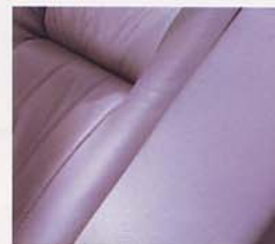
スペシャル本革グレー(6981)