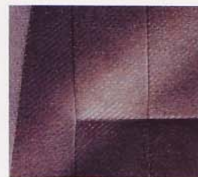
トリコトブラックグレー(6272)