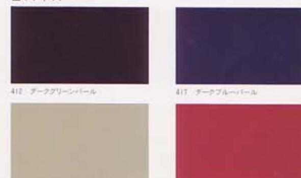
412 デークグリーンパール