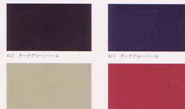
412 デークグリーンパール