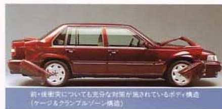
前・後衝突についても充分な対策が講じられているボディ構造 (ケージとクランプ・ブローン構造)

フロントシート のバックレスト 側面にエアバッグ を内蔵。横から の衝撃をセン サーが感知する