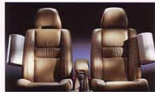
●体格やシートポジションを問わず、側面衝突の安全性を最大限に発揮します。

より高い安全性を確保するために、市販車としては世界で初めてサイド・エアバッグ“SIPSバッグ”を装備。