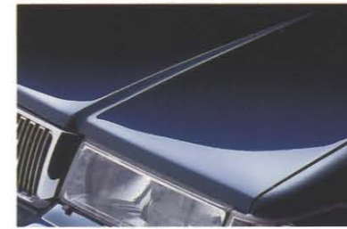
ダークブルーパール(417)