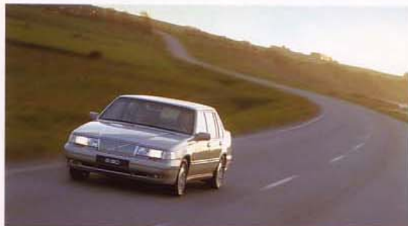
Top of Saloon S90 Classic