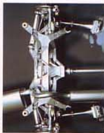
MULTI LINK REAR SUSPENSION マルチリンク・リアサスペンション

ゆとりあるパワーを効率的に路面に伝え、卓越したドライバビリティと快適な乗り心地を両立させるのが、優れた足回りです。マルチリンク式独立懸架サスペンションは、優れた走行安定性能が得られるコンスタントトラック・リアアクスルと、快適な乗り心地を実現する独立懸架リアアクスルの両方の長所を兼ね備。高剛性ボディとあいまって、高いロードホールディング性能と快適な乗り心地を両立させ、飛躍的な乗り心地の向上を実現しています。