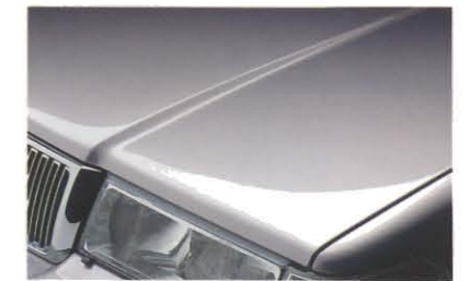
シルバーメタリック(426)