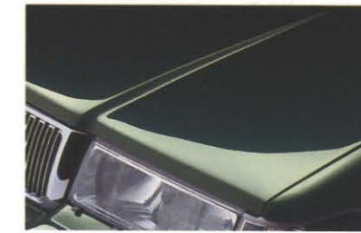
ダークオリーブパール(421)