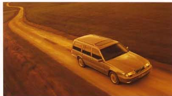
Top of Estate V90 Classic

ボルボを選択すること、それは環境保全に関して幅広い配慮を持って作られた車を所有すること。ボルボは、仕向地の法規制の有無にかかわらず、すべての乗用車にO 2 センサーと三元触媒コンバーターによる排出ガス浄化装置を搭載し、排出ガスをクリーンに保ちます。このシステムは1976年に米国の環境保護庁(US Environmental Protection Agency)から許可を受け、米国向けに採用されたものです。市販車にこのシステムを搭載した自動車メーカーはボルボが初めてで、現在でも、最も進んだガソリン内燃機関用の排出ガス浄化システムといえるものです。