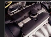
● インタークーラー付ターボチャージャー DOHC16-VALVEエンジン