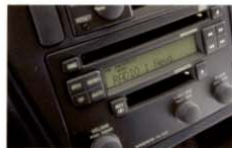
CDプレーヤー内蔵FM/AMカセットステレオ リスネットエディションにふさわしい、クリアな高音質サウンドが楽しめます。