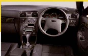
スポーティレザーステアリングホイール 径38mmの本革巻ステアリングホイール。