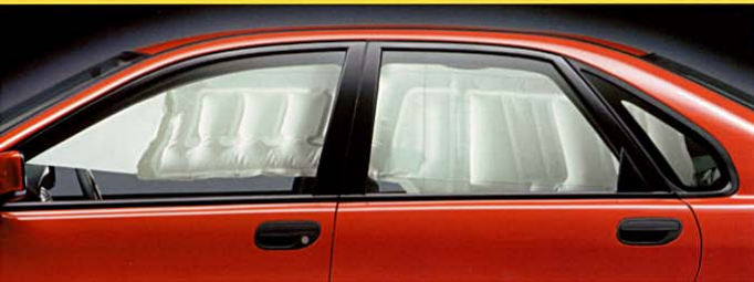
IC/インフレーターカーテン (頭部側面衝撃吸収エアバッグ) SIPSバッグとの相乗効果で、側面衝突時、前方、後方ともに、乗客の頭部を、効果的に保護します。