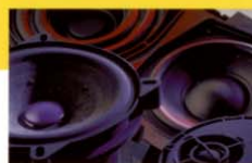
ハイパフォーマンス・ラウドスピーカー ワイドレンジ、ハイパワーのスピーカーシステムにより、豊かなサウンドを再現。さらに右後方のラゲッジスペースにパワーアンプ内蔵クローバーを採用。エステートの音響特性を追求した高品位7スピーカーシステム。

ダイナミックな走りの予感。機能性と上質感の巧みな調和のなかで、スκανジナビアンデザインの真価を存分に味わっていただけるV40 T-4の室内空間。臨場感あふれるプレミアムオーディオシステム、室内を快適に保つ空調、国際機関によるアレルギー認定証を受けたインテリア部材。スポーティなドライビングにふさわしい厳選の装備と、精悍なスペシャルデザインを誇ります。