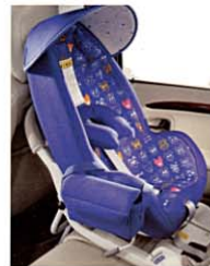
ISO FIX対応 ISO FIX対応チャイルド・セーフティシート ISO FIXは子供用の安全装備を取付けるための固 定システムです。後座窓側リアシート下のフロアパ ネルにISO FIX対応アタッチメント取付け用の準 備が施されています。

いち早く、子供専用の安全対策に取り組んできた、 ボルボ。日本でようやく着用が義務化されたチャイルド シートも、すでに1972年から導入を開始しています。 ボルボ40シリーズにも、ユニークな「インテグレートッド・ チャイルド・クッション」をはじめ、ISO FIX対応チャ イルド・セーフティシートなど、お子様の成長に合わせた 安全装備を用意しています。