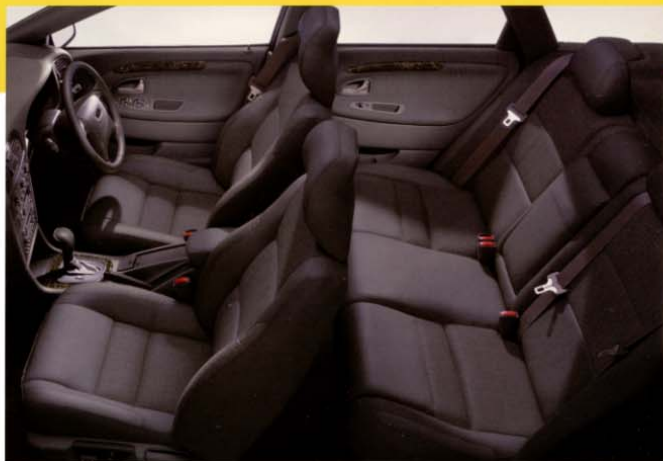
T-4専用スペシャル インテリア インテリアも引き締め6ブラックストーン+黒大理石調パネル、オフブラックを基調とした上質のファブリックと本革のコンビネーションシート“Visby”を採用。