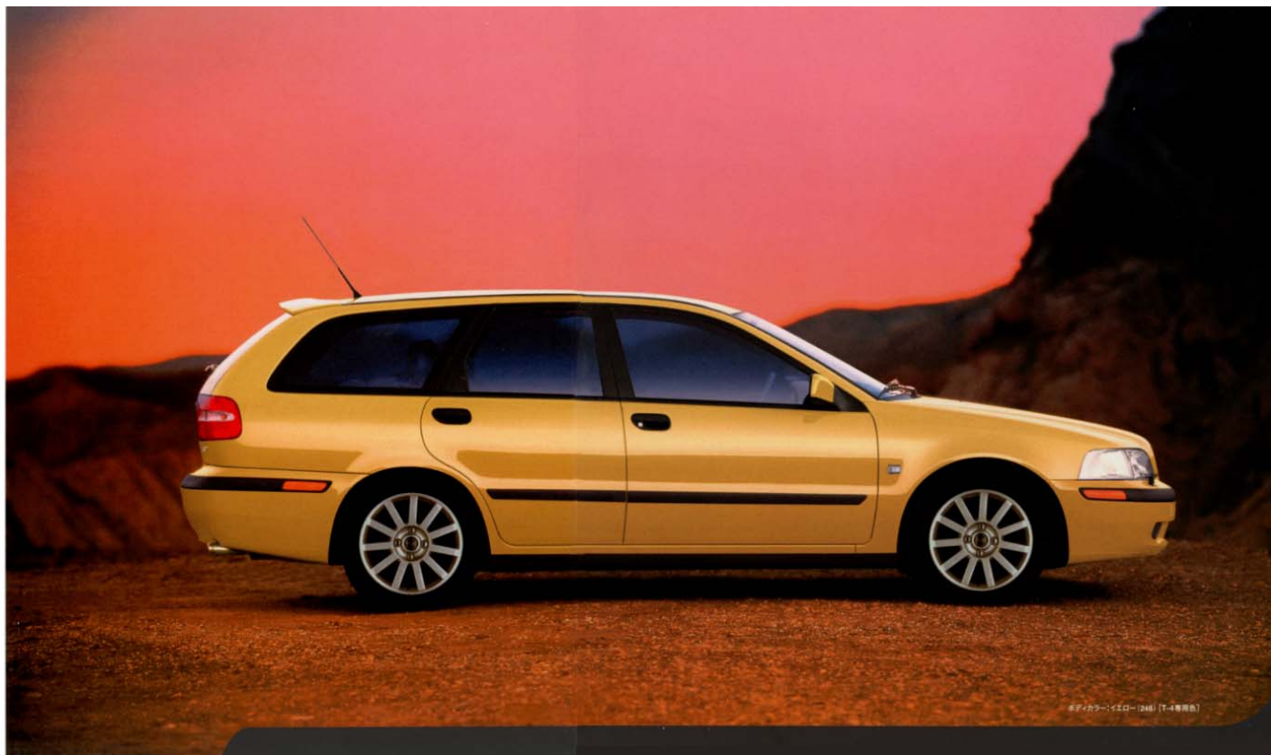
ボディカラー：イエロー（T-4専用色）

● ボディカラーは、印刷・撮影条件等により、実際のものとは異なって見える場合がございます。 ※写真の仕様は、日本仕様とは異なる場合があります。